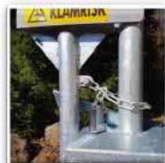
Lyftbom, låst med kätting och hänglås i öppet läge.

Tänk på att aldrig ha fingrarna i klykan där motviktsrör C lyfts och sänks mot moderstolpe A då det finns en klämrisk här! Använd kättingen för låsning med hänglås av bommen i öppet läge!