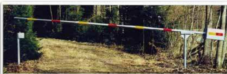
Lyftbom med motviktsbehållare fylld med grus till jämnviktsläge.