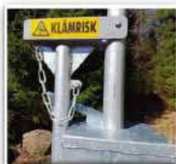
Lyftbom, klar för stängning i upplåst läge.